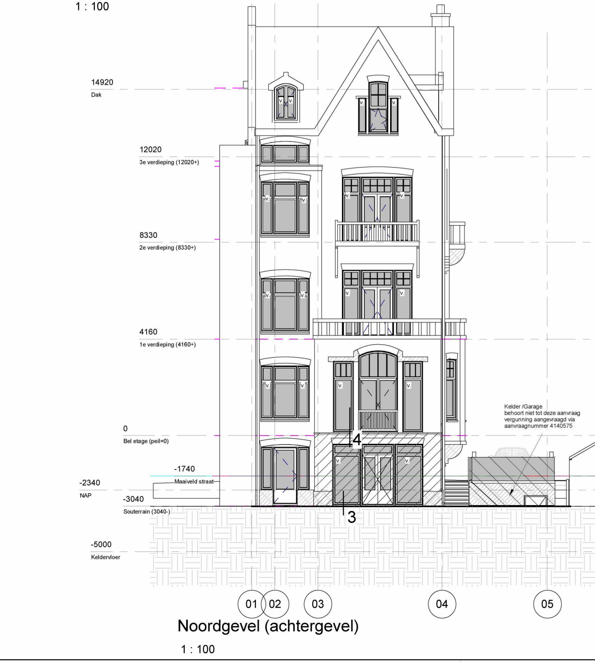
Noordgevel (achtergevel) 1 : 100