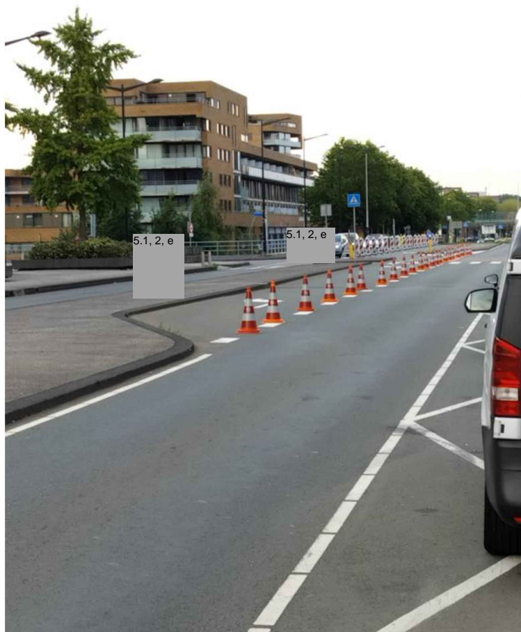
IMG_20250727_203848.jpg op 27-07-2025 21:00 door melder