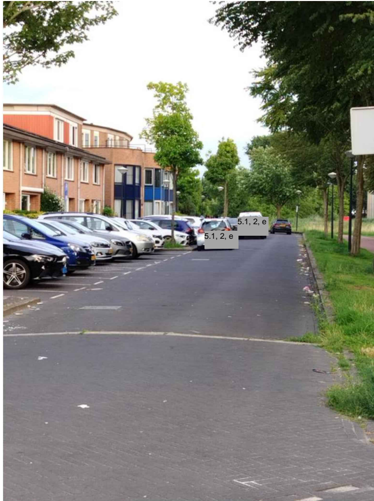
IMG_20250727_202512.jpg op 27-07-2025 21:00 door melder