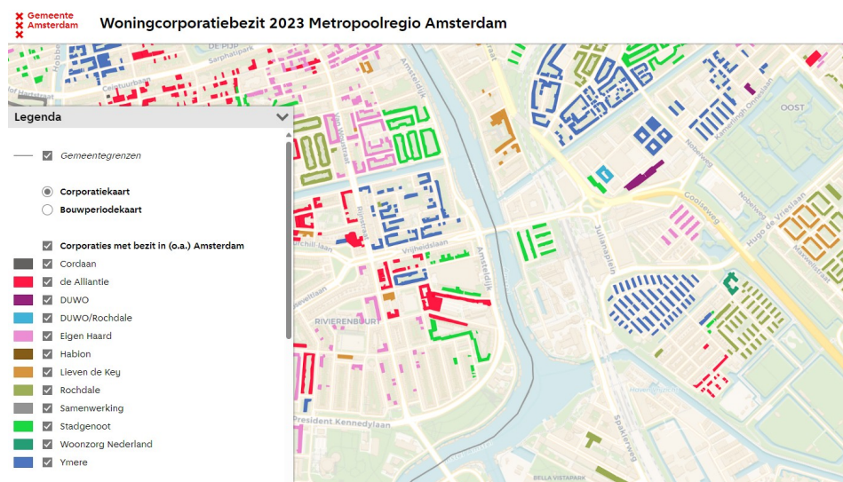
Afbeelding eigendom corporaties

Voor het vervolg ligt de focus op Julianapark, de wetbuurt en Tuindorp Amstelstation. Hierbij is het belangrijk samen te werken met coöperaties. Deze hebben hier veel bezit.