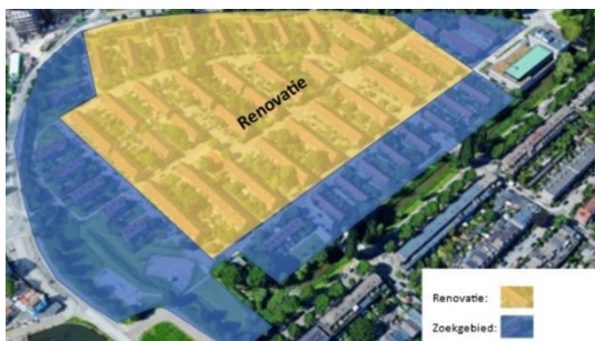
afbeelding van Ymere voor bewonersparticipatie in

Eerder hebben wethouder en portefeuillehouder van het stadsdeel aangegeven dat zij achter de sloop nieuwbouw staan als dit voldoende woningen toevoegt. Portefeuillehouder van het stadsdeel houdt zich vast aan het vertrekpunt dat er minimaal 100 woningen moeten worden toegevoegd. Voor Ymere is onderstaand zoekgebied voor verdichting en renovatie het uitgangspunt voor gesprek. Hoe de verdichting verder vorm krijgt wordt met bewoners verkent. Hiervoor richt Ymere een traject in. Het stadsdeel is nauw betrokken en heeft een projectgroep dit hieraan werkt. Deze context heeft invloed op de hieronder voorgestelde aanpak. We willen voorkomen dat het lopende traject van Ymere en bewoners een te grote stempel drukt op de bredere ontwikkeling.