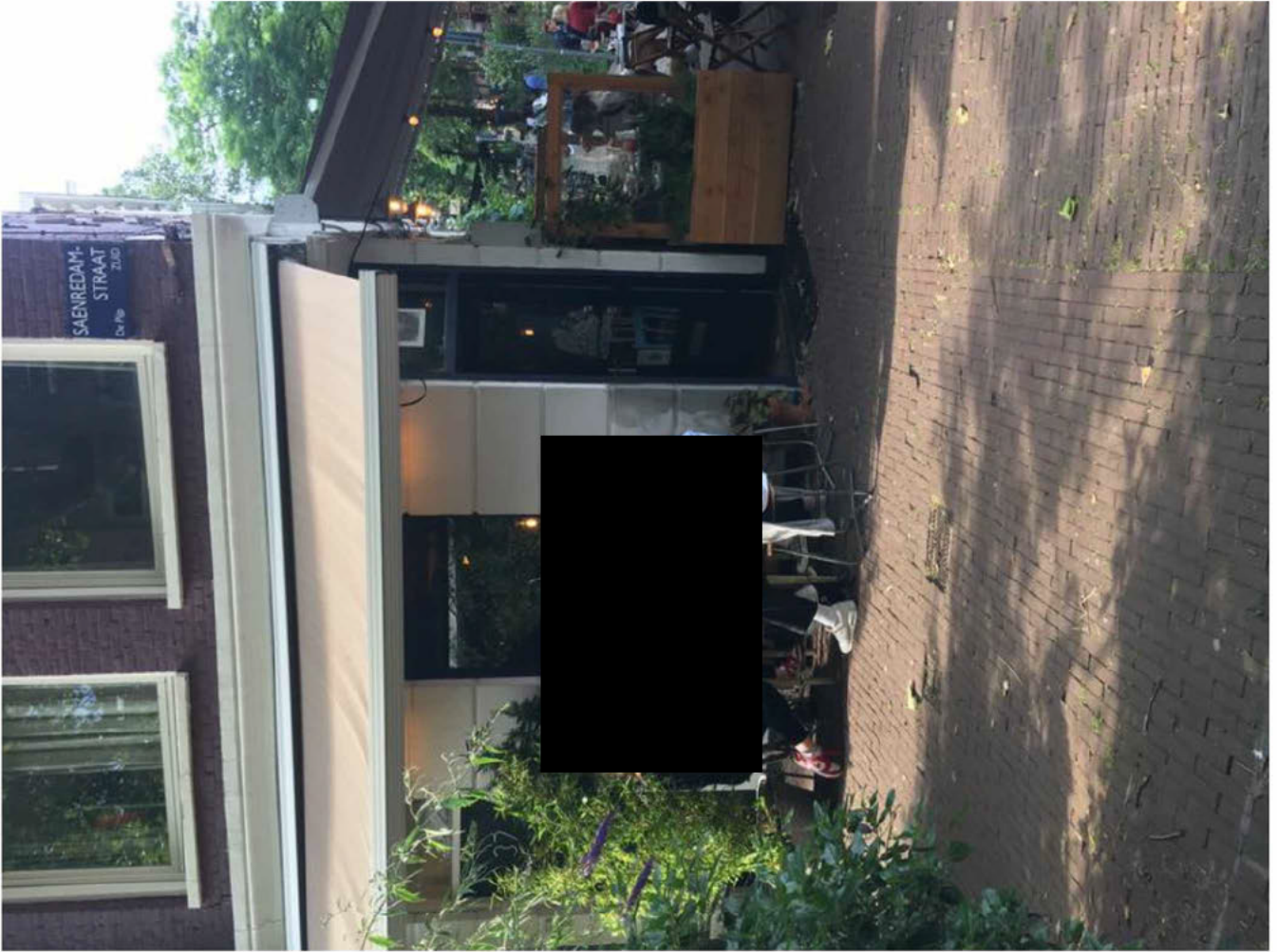
B34D9886-D9E6-48E0-8123-D8FB9F74412A.jpeg op 24-06-2022 19:31 door melder