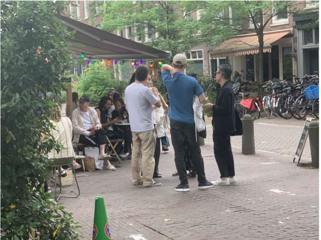
IMG_1331.jpeg op 14-07-2023 18:19 door melder