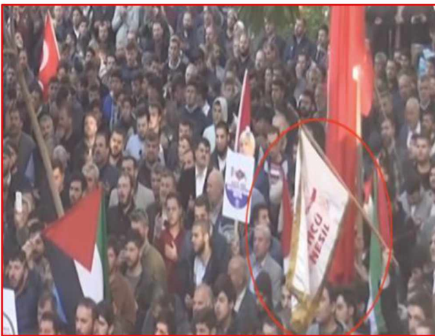
Öncü Nesil vlag bij demonstratie in Adana-Turkije

Internationaal waren er veel demonstraties tegen de beslissing van Trump. Alleen al in Turkije waren 81 demonstraties georganiseerd in verschillende locaties. 11 Bij een demonstratie in de Turkse stad Adana was een vlag van Öncü Nesil 12 te zien.