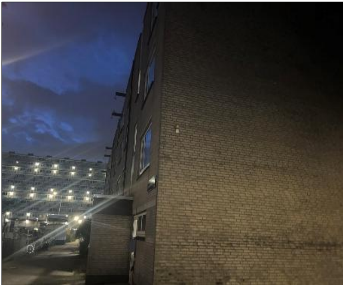
Er is weinig groen aanwezig in het plangebied wat foeragemogelijkheden beperkt.

Laatvliegers foerageren na het uitvliegen eerst kort in sociale groepen nabij de verblijfplaatsen. Daarna zoeken ze afzonderlijk de open jachtgebieden op. Deze liggen veelal in kleinschalig agrarisch gebied dat rijk is aan vochtige graslanden. Hierbij kunnen relatief grote afstanden worden afgelegd. Anders dan bij dwergvleermuizen maken laatvliegers minder gebruik van landschapselementen voor hun vliegroutes.