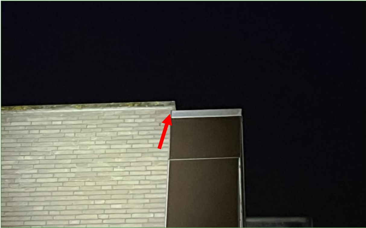
Locatie van het vastgestelde zomerverblijf van Gewone dwergvleermuis in de dakrand van de bebouwing binnen het plangebied.

Er werden geen bijzondere gerichte verplaatsingen opgemerkt van Gewone dwergvleermuis die zouden kunnen wijzen op een belangrijke vliegroute.