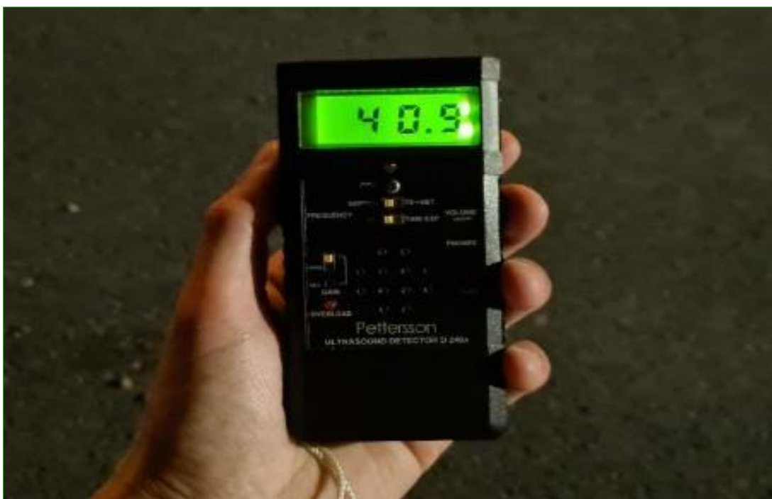
Nachtelijk onderzoek naar vleermuizen met behulp van een batdetector.

Tijdens het onderzoek werd tevens gebruik gemaakt van warmtebeeld-apparatuur (Lahoux Spotter Elite 35V en Lahoux spotter Pro V). Hiermee kunnen vliegpatronen van baltsende en foeragerende dieren en eventuele vliegroutes van overvliegende vleermuizen beter in beeld gebracht worden. Ook kunnen de aanwezige aantallen vleermuizen nauwkeuriger worden ingeschat en kan in volledige donkere situaties (zoog)zwermactiviteit, late uitvliegers en terugvliegende dieren naar verblijfplaatsen worden opgemerkt zonder dat hier (kunst)licht voor nodig is. Hierdoor wordt onnodige verstoring van vleermuizen en omwonenden voorkomen.