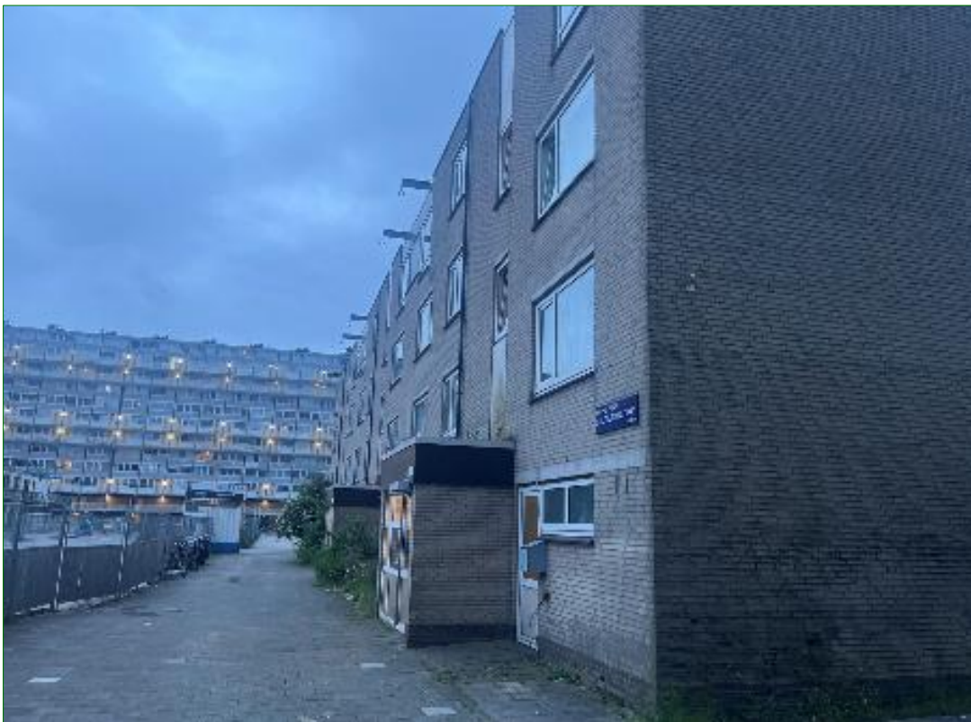
Hoge bebouwing aan de Wilhelmina bladergroenstraat.

Tijdens het onderzoek naar vleermuizen is ook gelet op andere beschermde soorten.