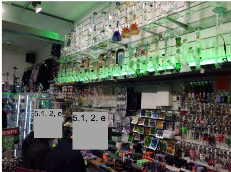
31-10-2017: in hoofdzaak in gebruik als headshop.

Volgens de controle uit oktober 2017 bestaat circa 70% van het assortiment uit headshop-artikelen. Daarnaast blijkt uit de 5.1, 5 - naam op de gevel, de etalage en uit de inhoud van de winkel een duidelijke headshop-uitstraling. De beschikbare informatie maakt dan ook aannemelijk dat u de zaak al voor 6 oktober 2017 gebruikt als headshop, in strijd met het (toenmalige) bestemmingsplan (Postcodegebied 1012). Belangrijk uitgangspunt bij overgangsrecht is dat strijdig gebruik niet mag worden voortgezet. 11 Overgangsrecht is dan ook niet van toepassing.