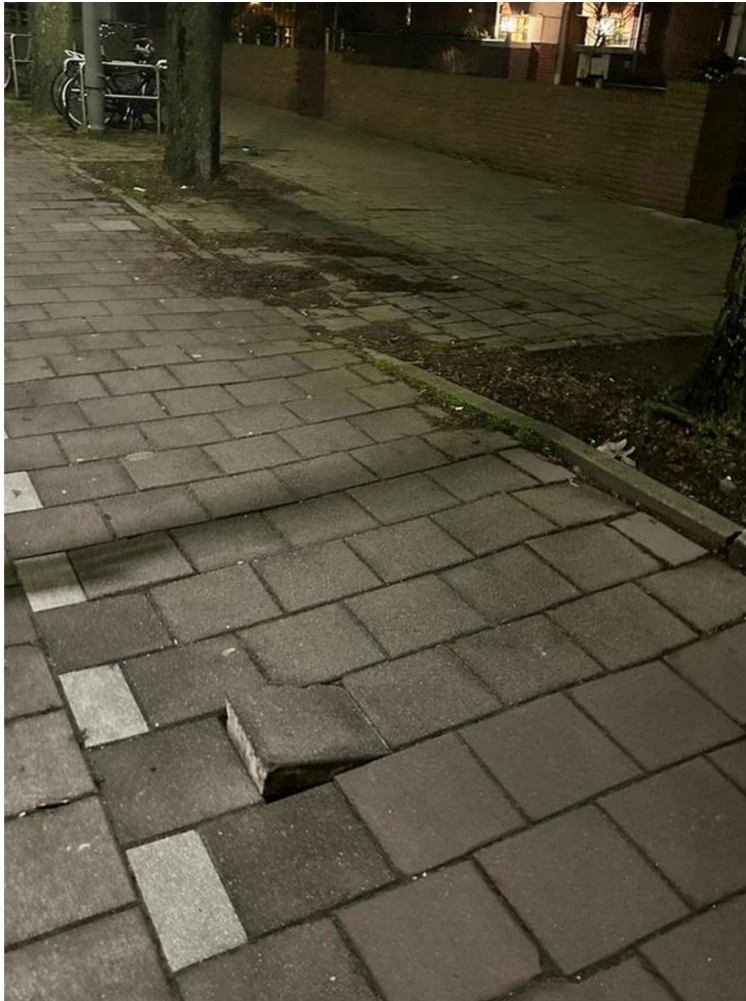
dm_media_cache_20.jpg op 22-02-2023 11:07 door melder