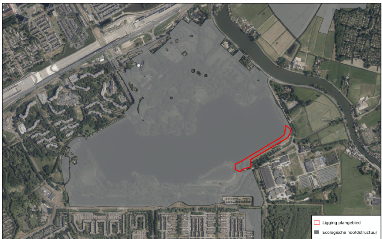
Afb.5: Ligging van het plangebied t.o.v de ecologische hoofdstructuur.

Het plangebied is onderdeel van de hoofdgroenstructuur Amsterdam (afb.6). Bij definitieve ruimtelijke ingrepen moet de technische Advies commissie (TAC) een oordeel vellen over de ruimtelijke ingreep. Bij tijdelijke ruimtelijke ingrepen zoals een festival zijn de regels niet duidelijk. Het is aan gemeente Amsterdam een oordeel te vellen over de wenselijkheid van een festival in de hoofdgroenstructuur.