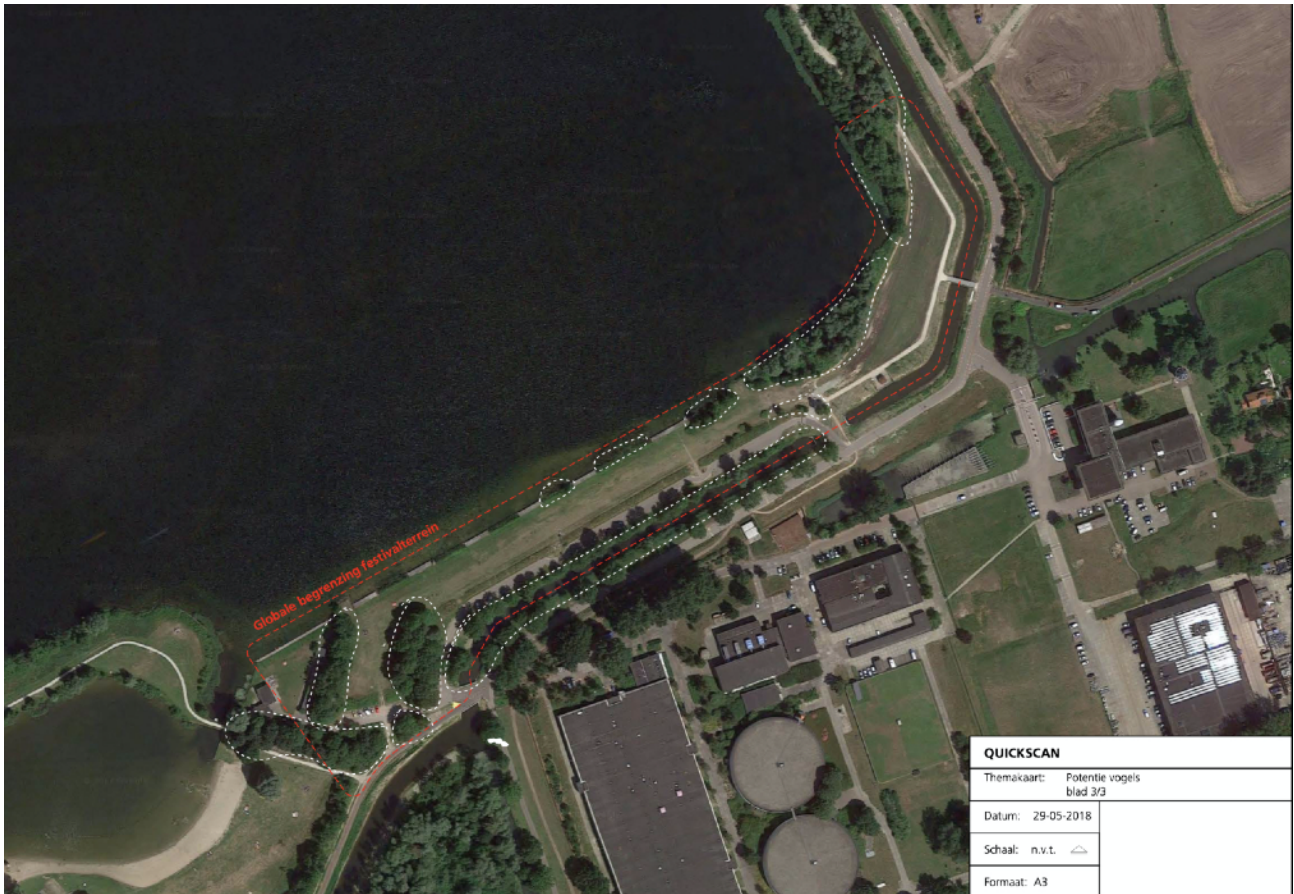
Afb.1: Kaart van het beoogde festivalterrein

Het plangebied en beoogde festivalterrein is gelegen aan de Driemondweg aan de Gaasperplas. Het is een recreatieterrein bestaande uit parkeerplaatsen langs een grasveld aan de Gaasperplas. Aan de waterkant zijn enkele steigers parallel aan de oever en daartussen liggen rietkragen. Het parkeerterrain is omzoomd door enkele bossages en een sloot.