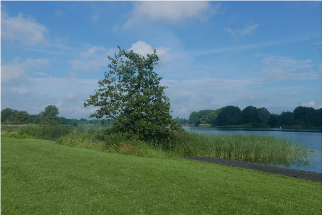
Afb.3: Rietkraag waarin kleine karekiet broedt. Water toegankelijk via steiger.