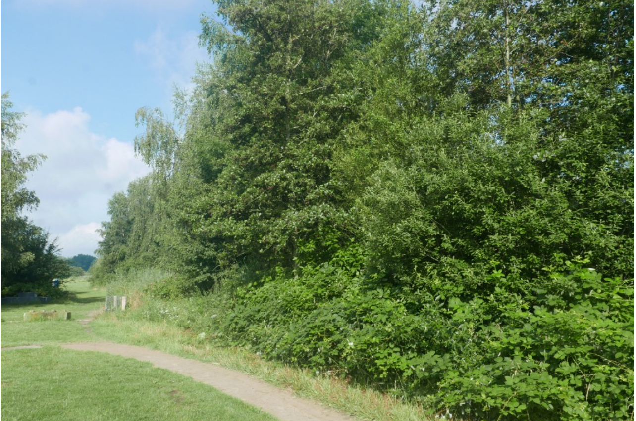
Afb.4: Bossages met onderbegroeiing van braam en brandnetel nodigen niet uit tot betreden.