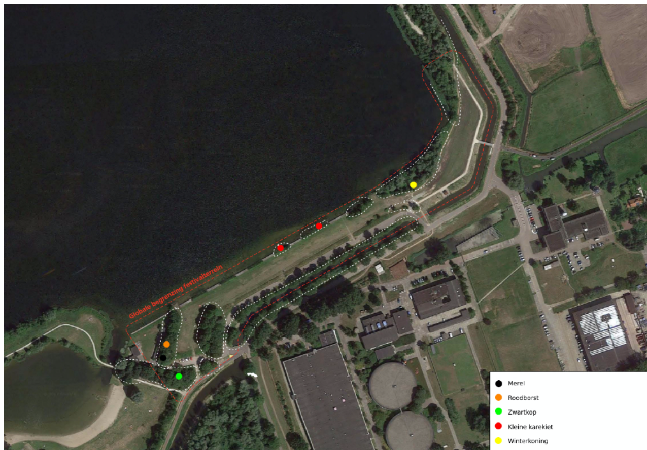
Afb.2: Locaties van de broedgevallen op het festivalterrein. Verstoring dient te worden voorkomen.

Op 4 juli 2021 is, conform afspraak om binnen vijf dagen voorafgaand aan werkzaamheden, een broedvogelcheck gedaan. Deze is gedaan van 6:30 tot 9:00. Daaruit blijkt dat er op enkele plekken nog algemene broedvogels aanwezig zijn. Het betreft enkele zeer dichte bossages en twee rietkragen (afb.2). Gezien de vogels hier broeden gezien de reeds intensieve recreatiedruk, van watersporter en wandelaars met honden, doet vermoeden dat deze nesten ook door de aanwezigheid van een festival niet snel verstoord zullen raken. Het water kan worden betreden via de steigers zonder door het riet te gaan, iets wat nu ook gebeurt en schijnbaar niet tot verstoring leidt. En de bossages zijn op de bodem begroeid met braam en brandnetel. Desondanks moeten deze zones worden afgeschermd middels linten en informatiebordjes zodat deze niet betreden zullen worden. In de bijlage is een kaart opgenomen met alle waarnemingen van vogels.