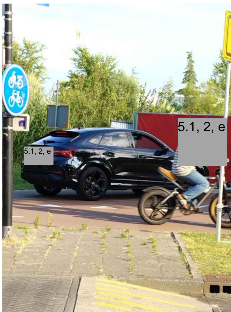
fietspad.jpg op 18-07-2025 19:54 door melder