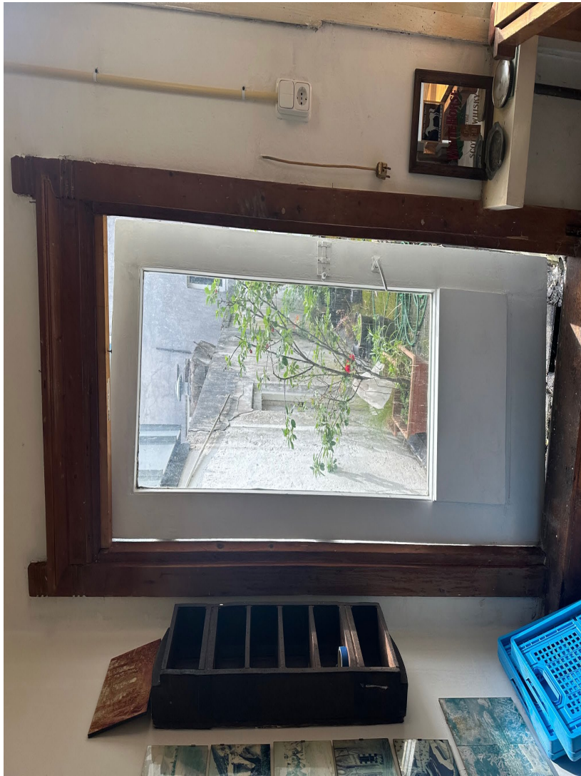
4x groot draadglas vervangen in lichthof trappenhuis.