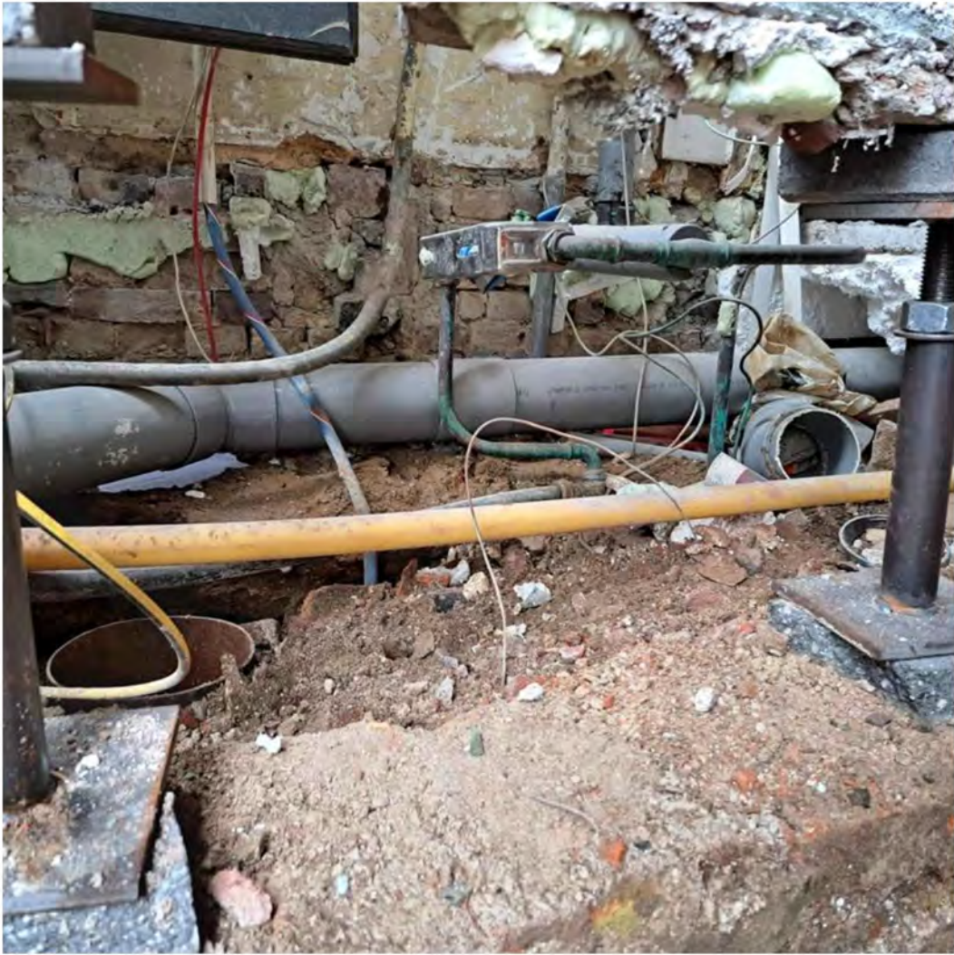
FUND (3) - 10-12-2025 14:42