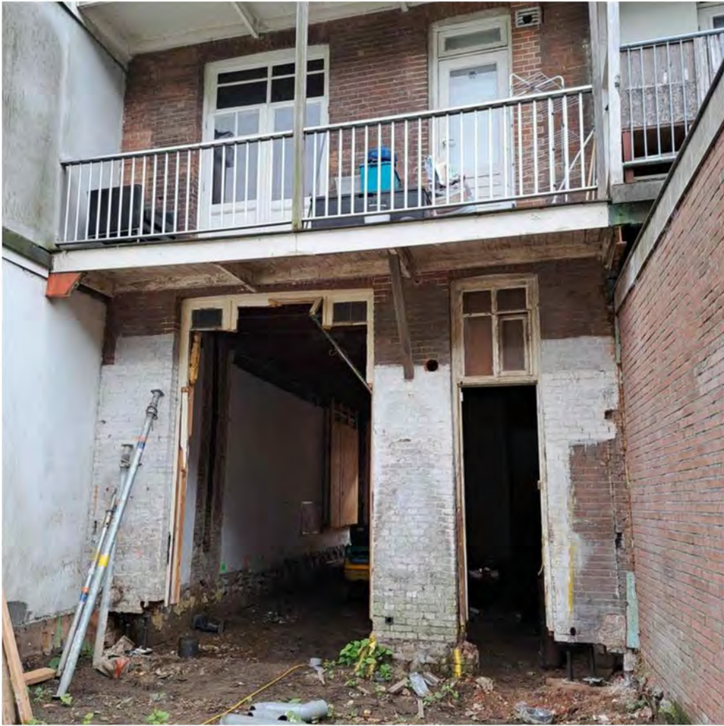
FUND (8) - 10-12-2025 14:42