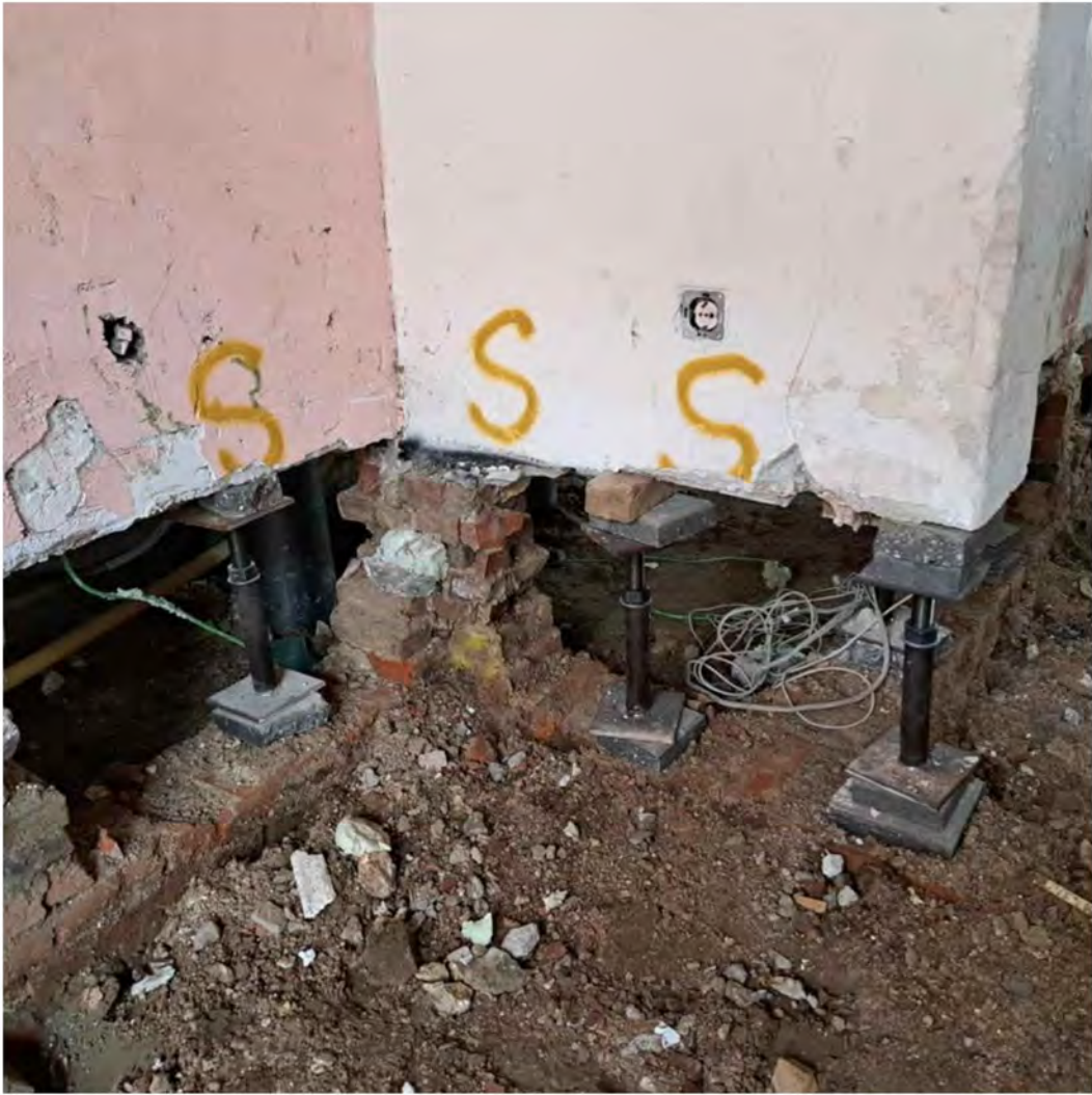
FUND (5) - 10-12-2025 14:42