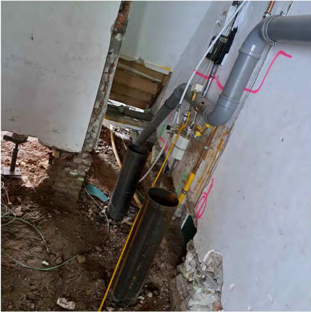
FUND (1) - 10-12-2025 14:42