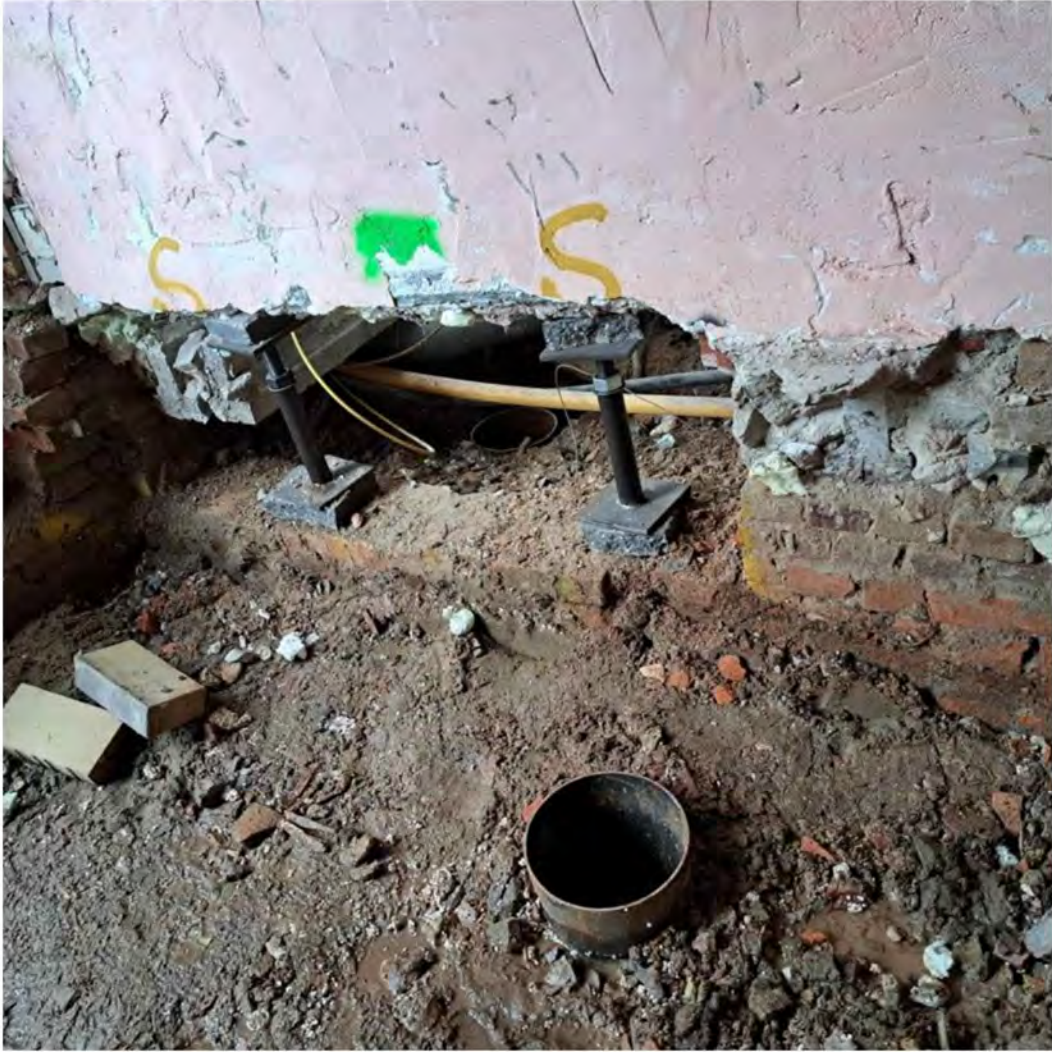
FUND (7) - 10-12-2025 14:42