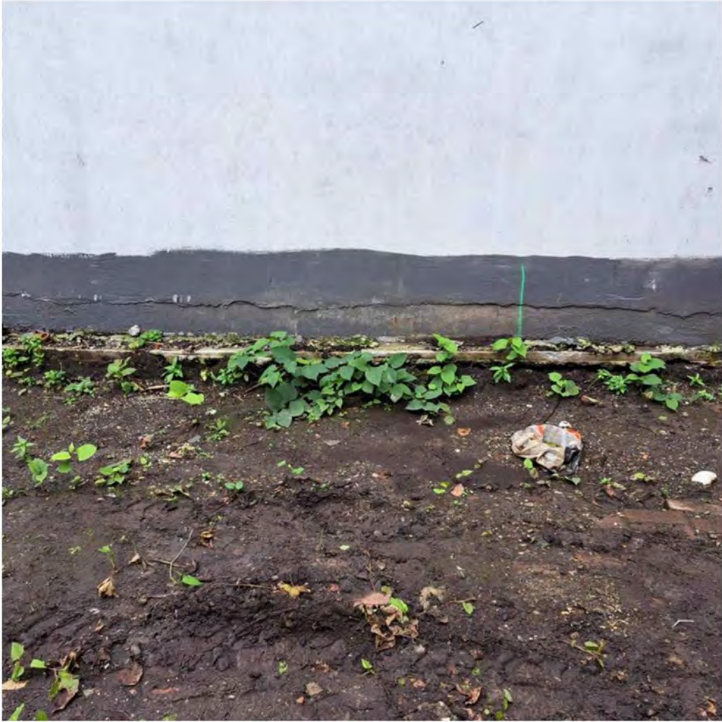
FUND (4) - 10-12-2025 14:42