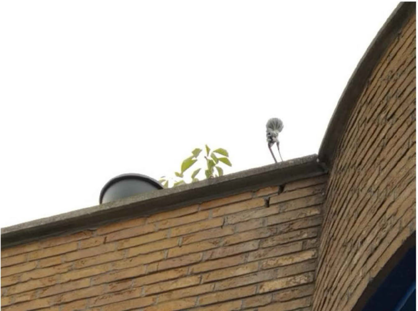
Kwaku25geluidTroepiaalsingel.jpg op 13-07-2025 18:20 door melder