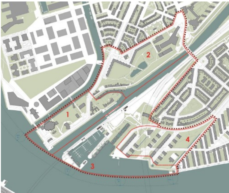
1-Tolhuistuin, 2-Laanwegkwartier (uitgesteld tot 2020), 3-Sixhaven en 4-IJplein-West