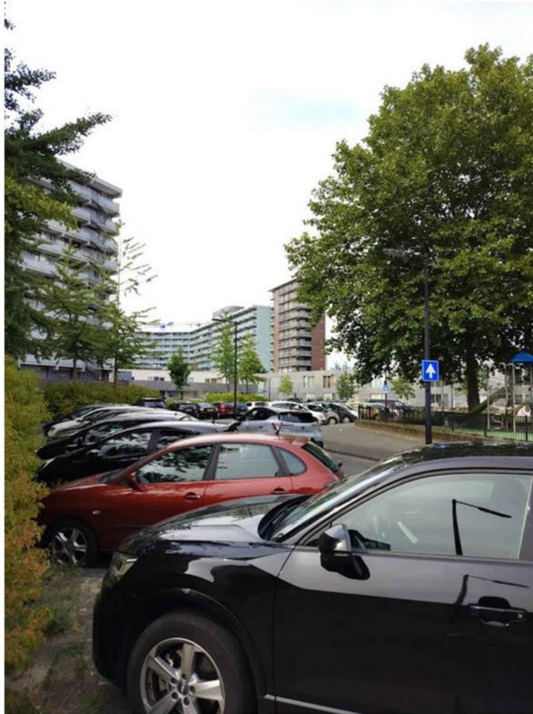
Fbuurt3.jpg op 20-07-2025 13:08 door melder