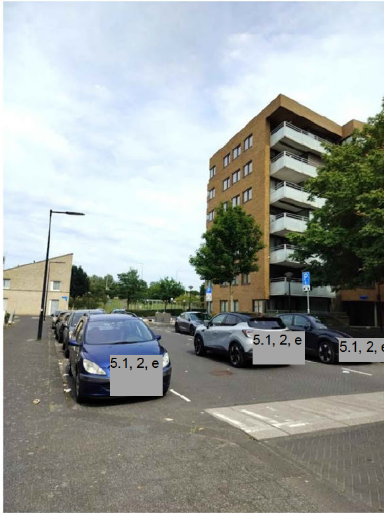
Fbuurt2.jpg op 20-07-2025 13:08 door melder