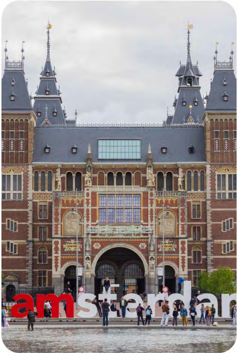
berths in city center