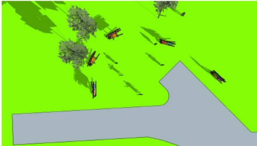
Bovenaanzicht situering Mooibouwborde