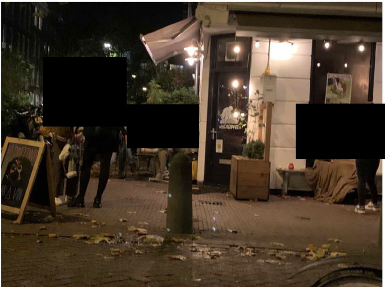
D3CE5EC7-0CA9-489A-95C6-6403EA50DC48.jpeg op 17-11-2022 23:04 door melder