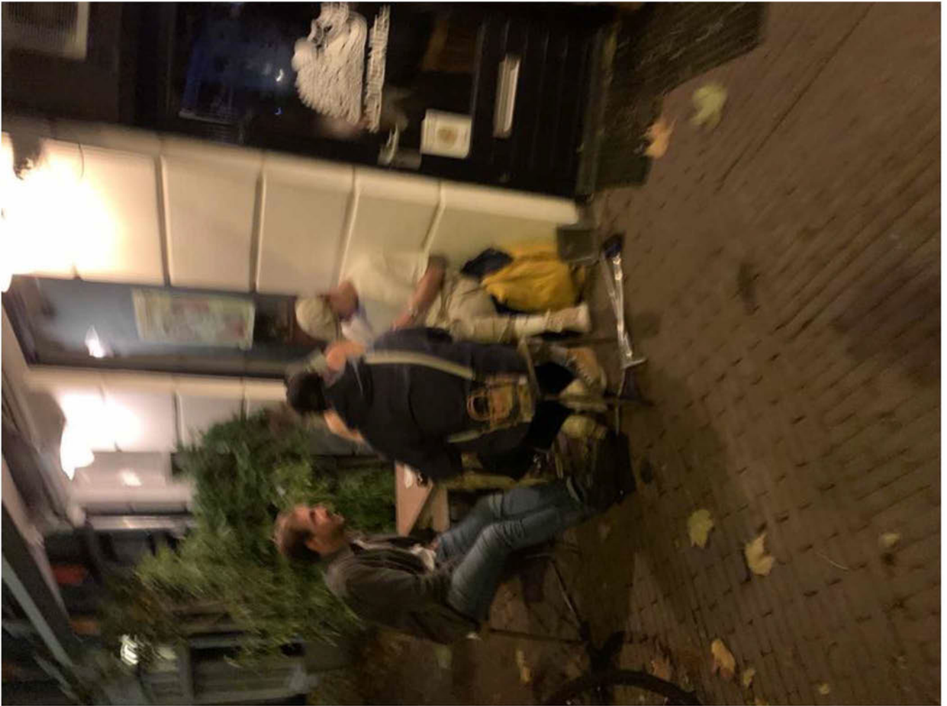
13A92DB5-2DAA-42CB-9F27-4DC8AE443704.jpeg op 17-11-2022 23:04 door melder