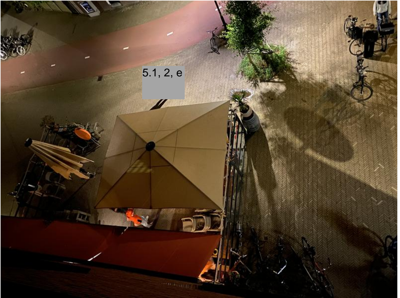
2024-07-07_00h29_IMG_4838.jpeg op 07-07-2024 12:29 door melder