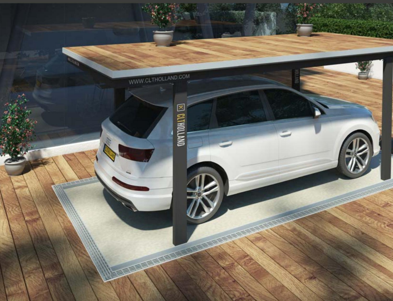
Down-parker Tuin & Oprit

Het revolutionaire, ruimtebesparende, ondergrondse parkeersysteem