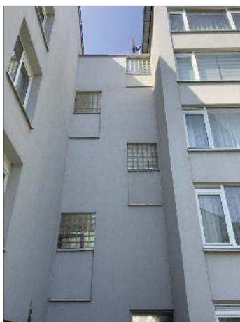
Afbeelding 4: Aanzicht tussengevel Ookmeerweg