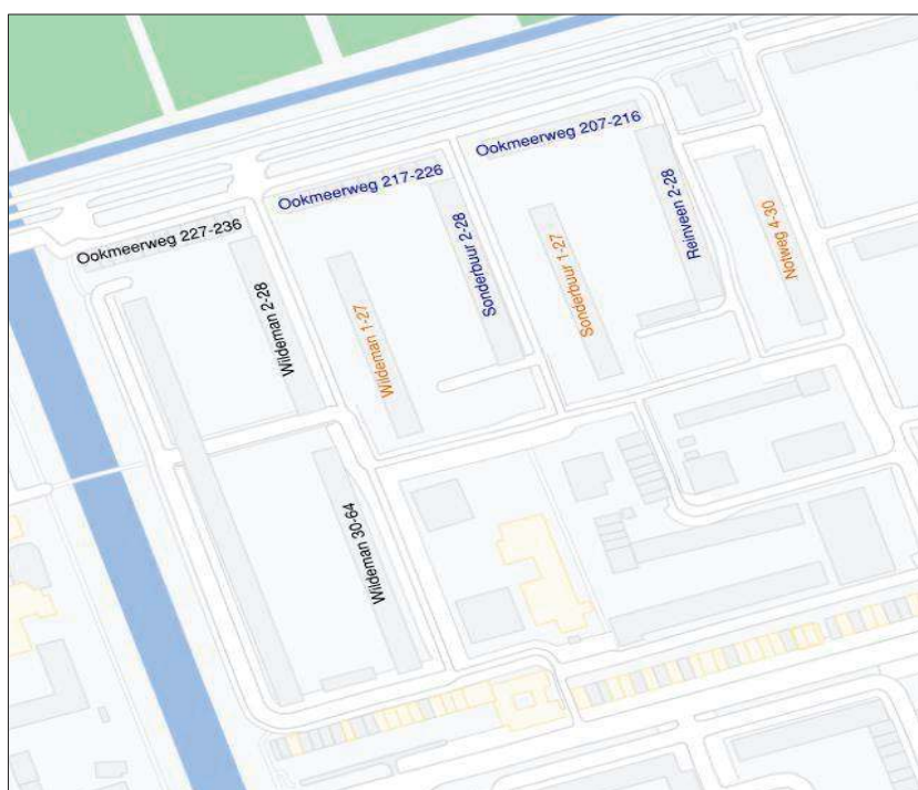
Afbeelding 1: Situatie van de complexen