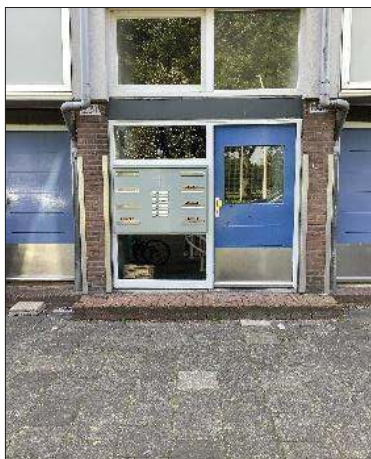
Afbeelding 2: Fragment voorgevel Ookmeerweg