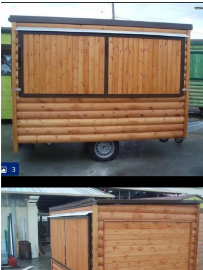
Inspiratiefoto materiaal (oud hout)