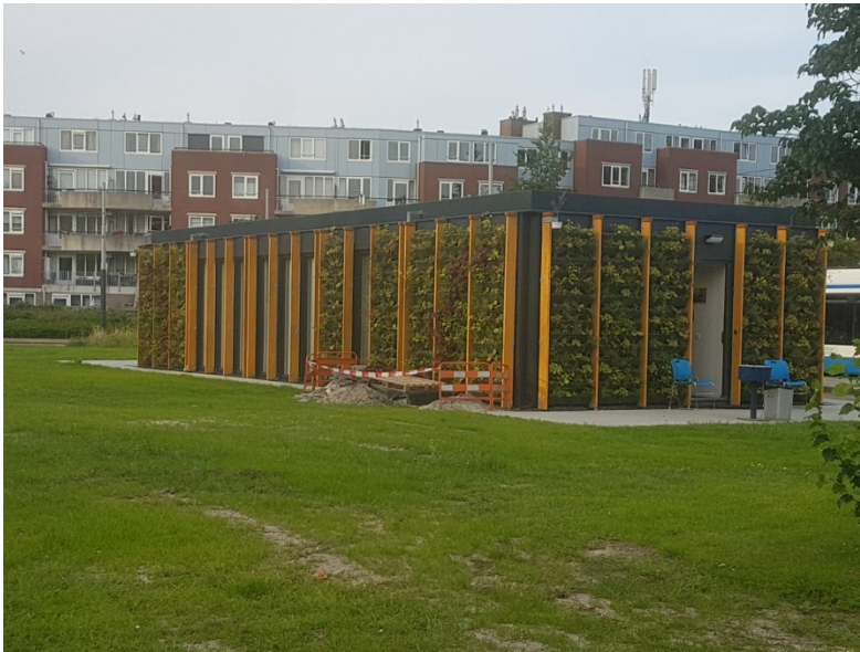
Inspiratiefoto exterieur (fresh garden look)