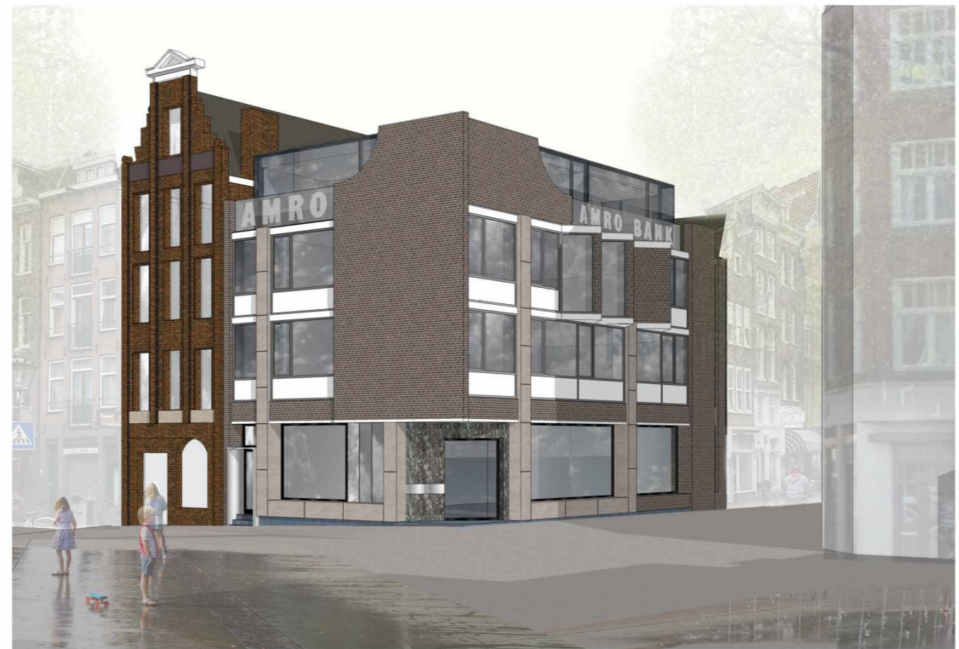
Haarlemmerplein nr. 2 Renovatie en herbestemming gebouw Arthur Staal

Overzicht van het ontwerpproces en de gemeentelijke adviezen AHAM | HP architecten | ANAROCHA ARCHITECTURE