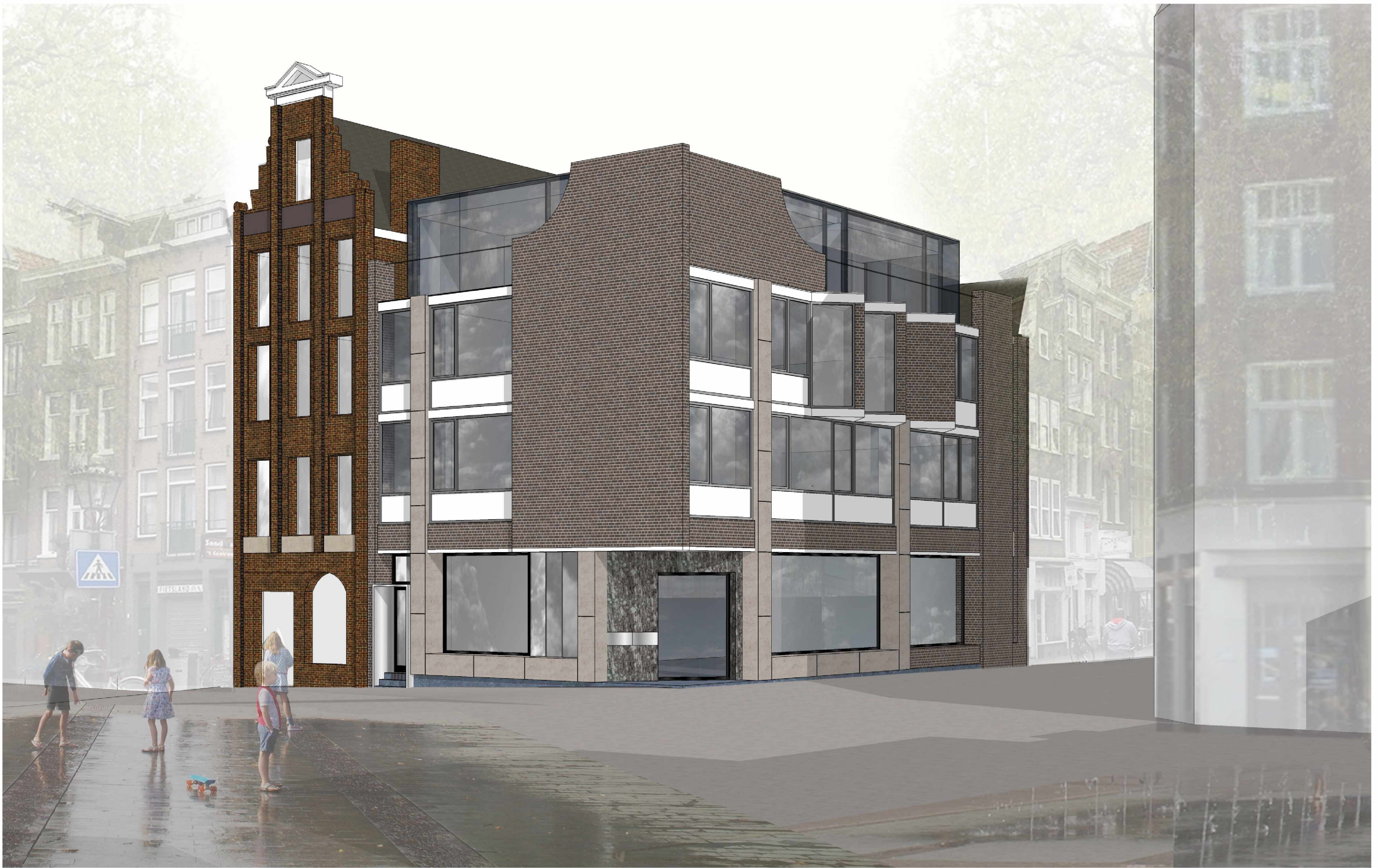
Alternatief voorstel zonder glasbalustrade