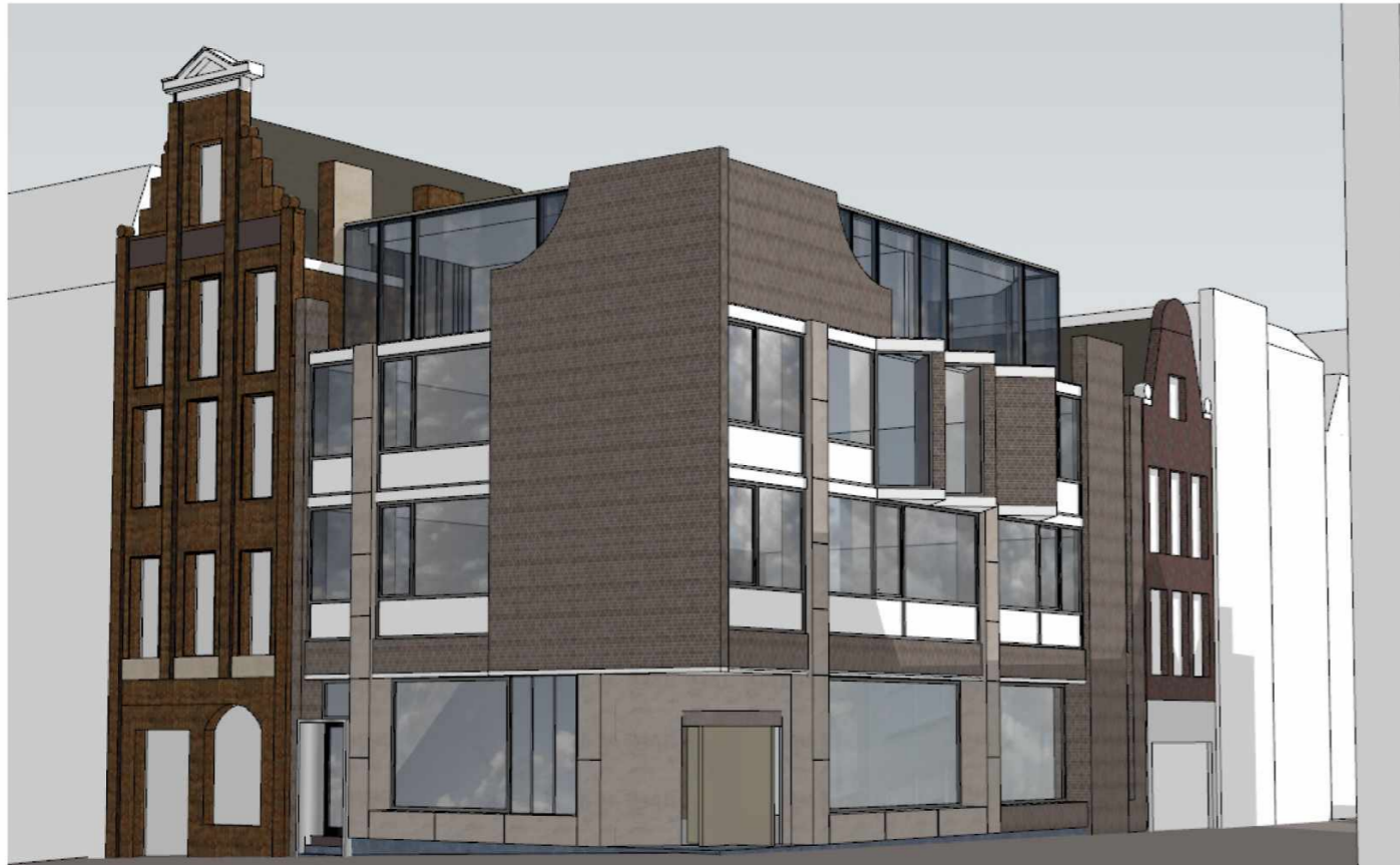
Optopping gebaseerd op het advies van de welstandscommissie: de optopping dient terughoudende te zijn.