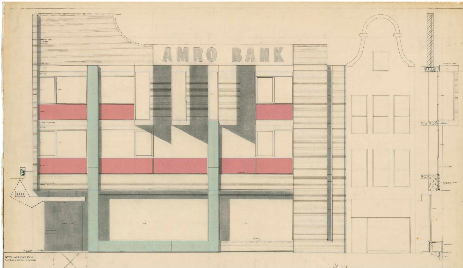
A. Staal: reclame-uiting