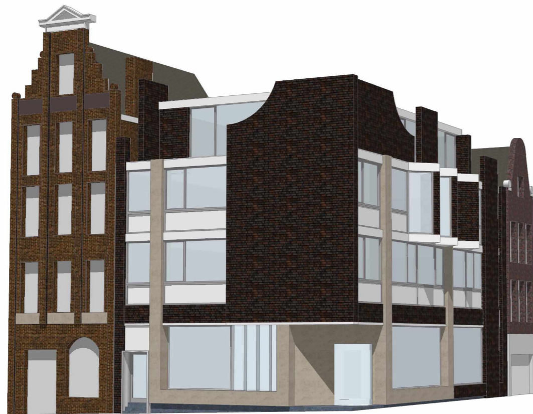
Onderzoek naar transformatie bestaand + optopping 1 laag (150m2 bvo) geinspireerd op de taal van A.Staal . Studie 1