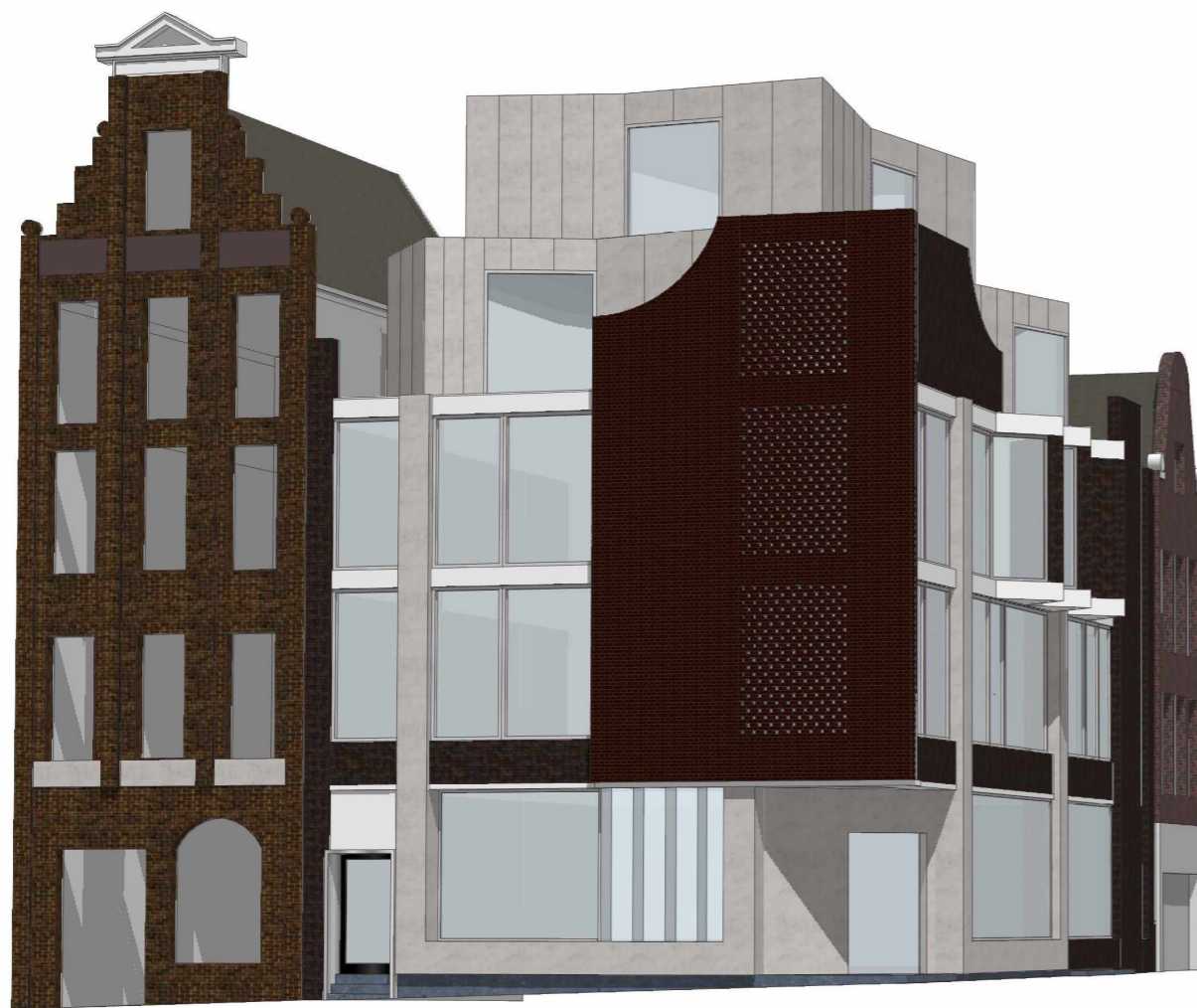
Onderzoek naar transformatie bestaand + optopping 2 lagen

Een éénlaagse opbouw moet zich vanzelfsprekend voegen. Daarbij is de keuze voor een extreem contrast, zoals nu voorgesteld, niet vanzelfsprekend. Een zoektocht naar de juiste gradatie van contrast en familie is nodig. De sleutel ligt waarschijnlijk meer in aansluiting, door het overnemen van ritme of materiaal, dan in contrast. Daarnaast kan een onderzoek naar hoe Staal zelf dakopbouwen maakte, een inspiratie zijn voor het ontwerpen van de extra bouwlaag.