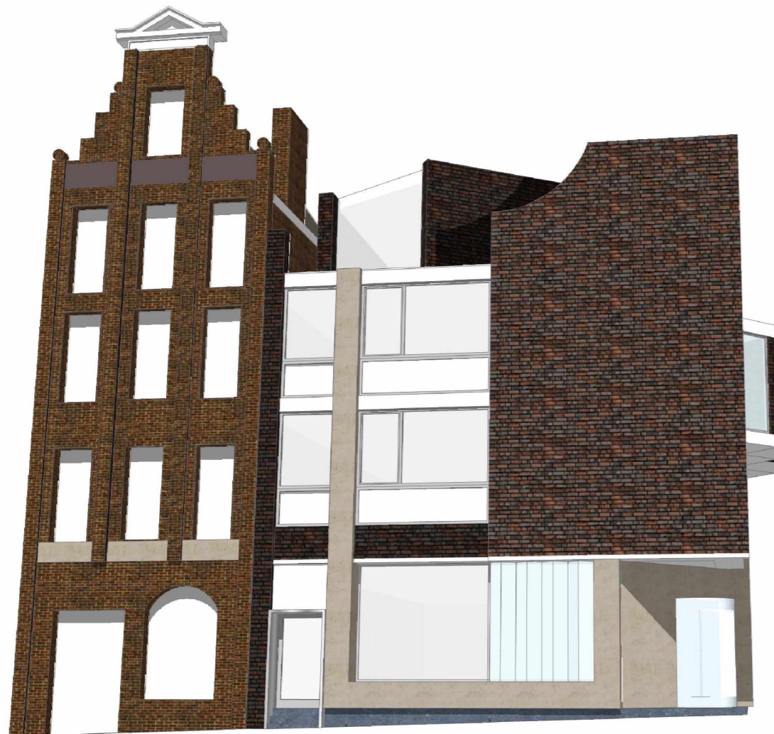
Onderzoek naar transformatie bestaand + optopping 1 laag (150m2 bvo) geinspireerd op de taal van A.Staal . Studie 6

Presentatie aan de welstandscommissie op 10 juli 2019 :