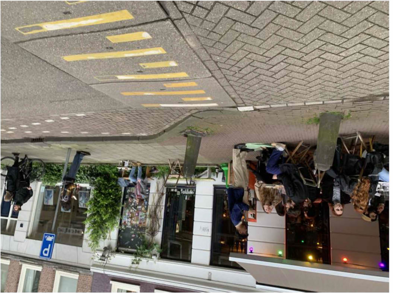
IMG_1121.jpeg op 12-05-2023 12:56 door melder