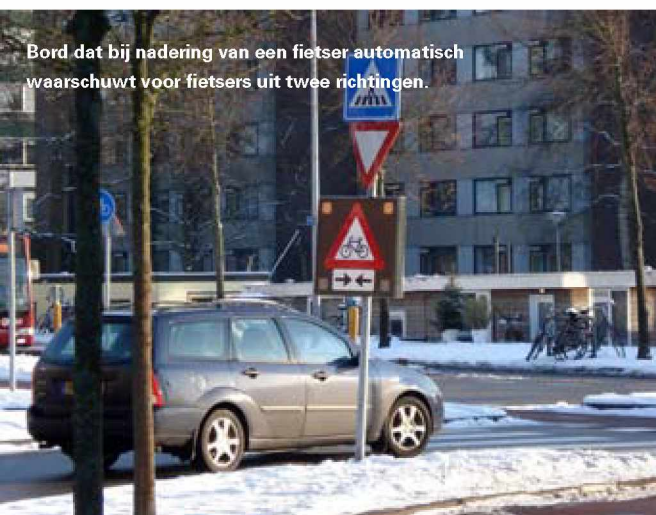
Bord dat bij nadering van een fietser automatisch waarschuwt voor fietsers uit twee richtingen.