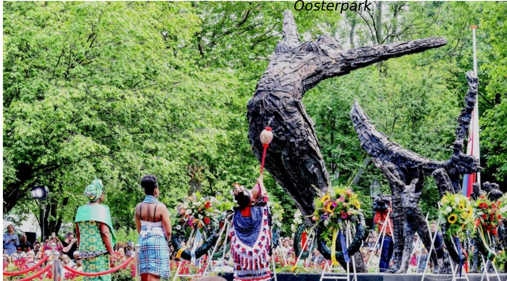
Herdenking Afschaffing Slavernij Oosterpark