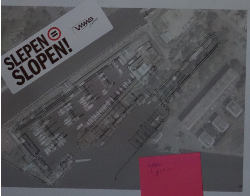
Optie 4: Sixhaven open voor iedereen