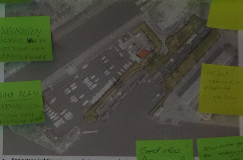
Optie 1: iets meer openbaar g...