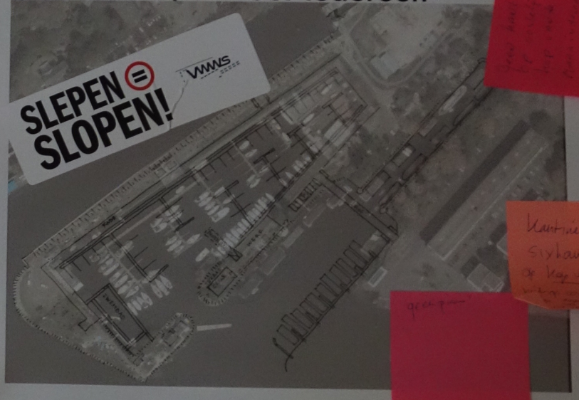
Optie 3: Sixhaven XL open voor iedereen