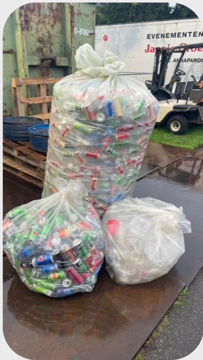
Resultaat scheiding zaterdag

Met het werk van de Cleanteams zijn de statiegeldbakken in ieder geval schoon gehouden van ander afval, zodat de zakken met een schone stroom ingeleverd en gedoneerd kunnen worden!