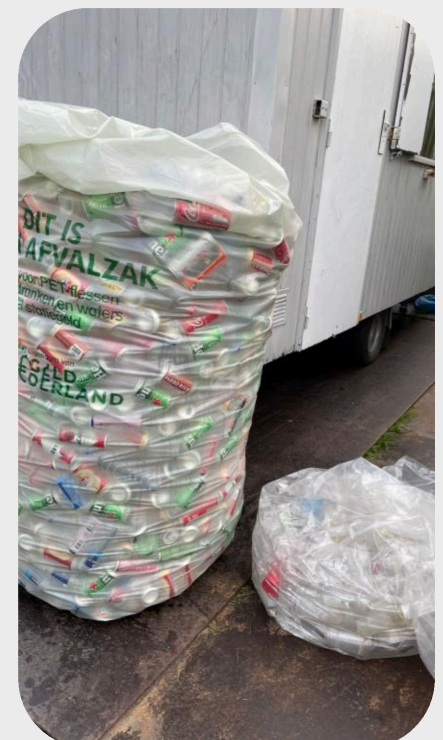
Resultaat scheiding zondag