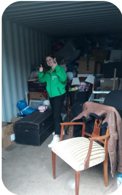
@Willem Witsenstraat 18.55u