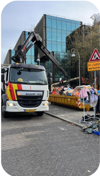
@Willem Witsenstraat 18.29u