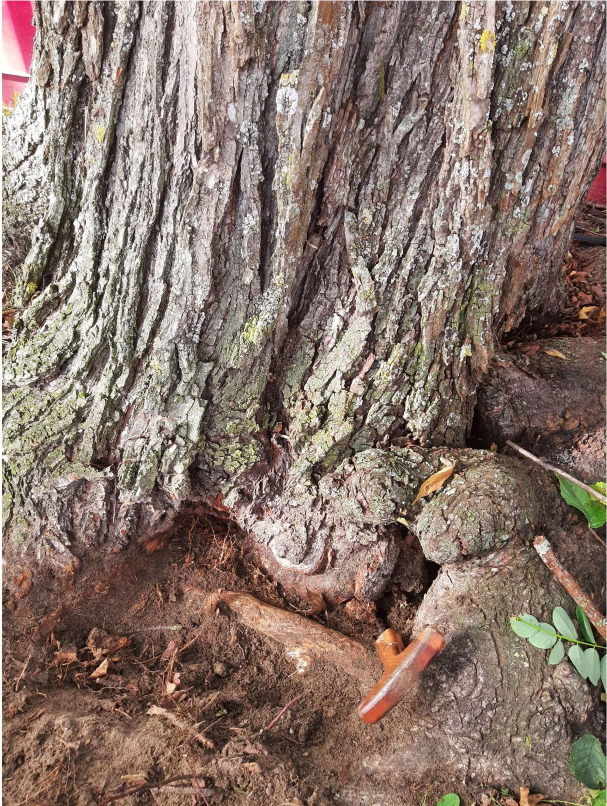
Controle rotting met prikstok