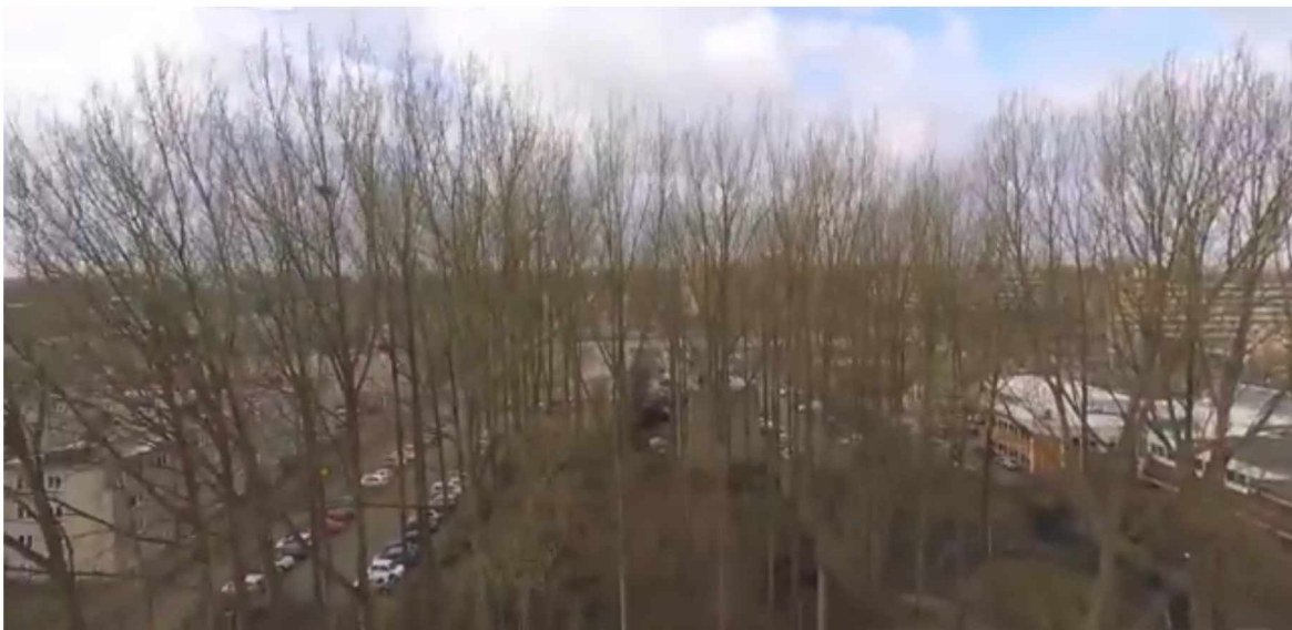
Uitzicht vanaf de Anslinflat richting het westen, met rechts het stadsdeelkantoor en links het fietspad richting Hoeken. Foto gemaakt in 2016.

groen verliest. Het gaat mij dus niet zozeer om de huidige situatie vergeleken met de situatie zoals voorgesteld in het stedenbouwkundige plan, maar het gaat mij om de trend van de afgelopen jaren: steeds minder groenstroken, steeds minder bomen, steeds meer steen. Terwijl het juist zo belangrijk is om tussen de bebouwing groen te hebben, omdat de zomers steeds warmer worden.