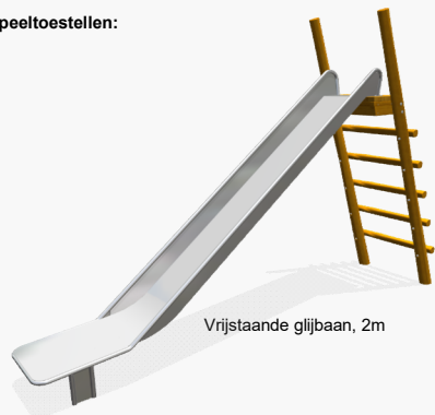
Vrijstaande glijbaan, 2m