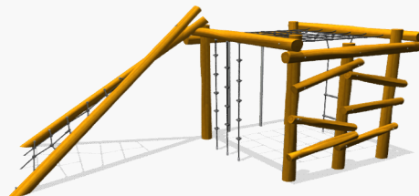
Klimkubus met opklimnet