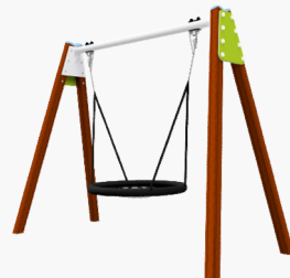
Vogelsnest schommel, 1,2m