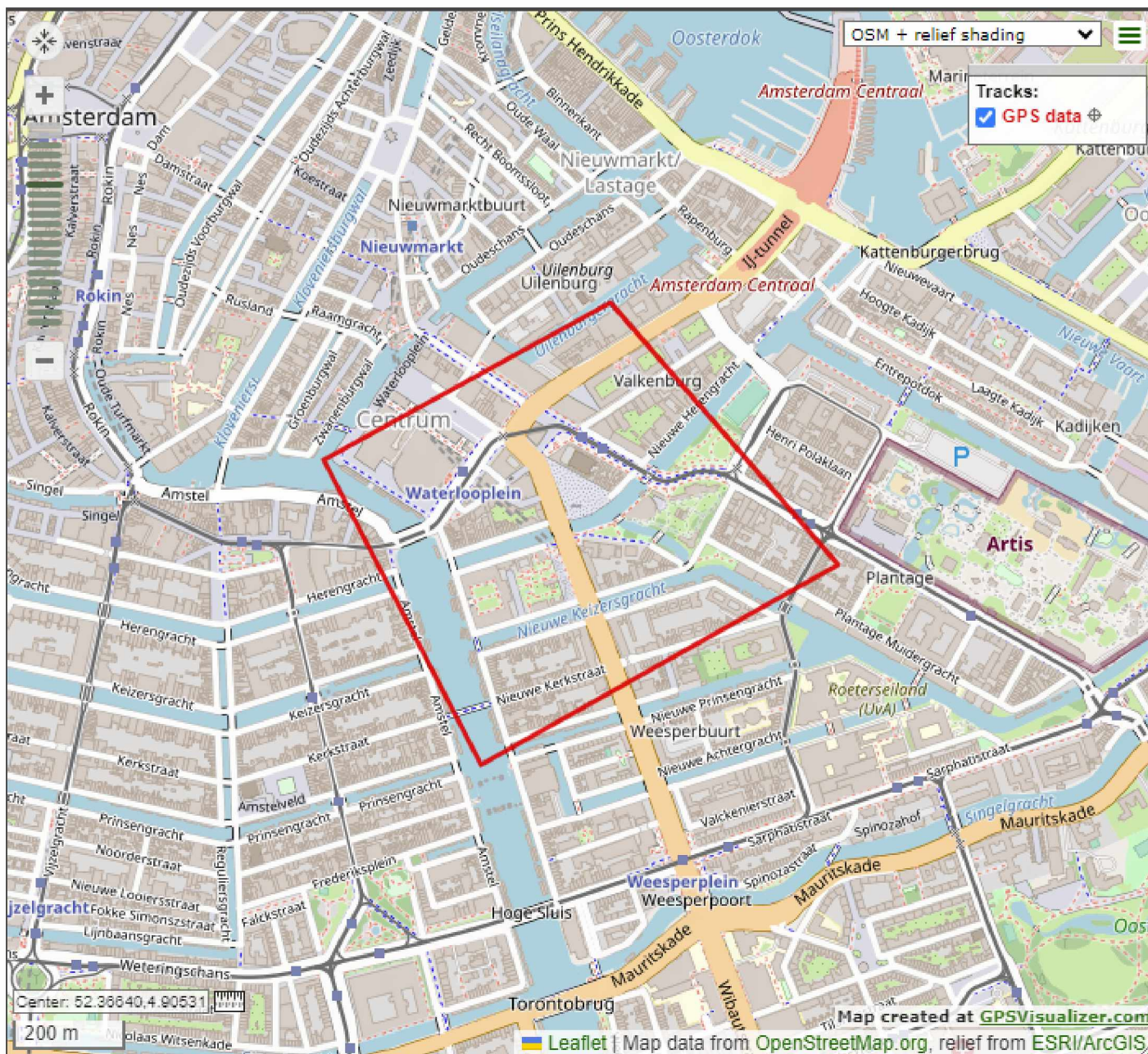
Plaatje 2: Rode vierkant is afgebakend gebied waarbinnen geteld is